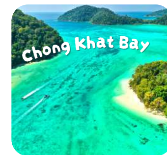
Chong Khat Bay